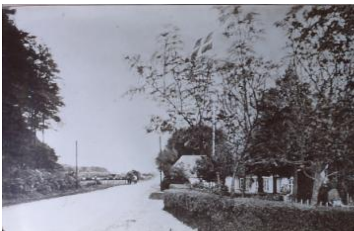
Amtsvejen v Bøffelkobbøl set mod Nybøl, uden dato.